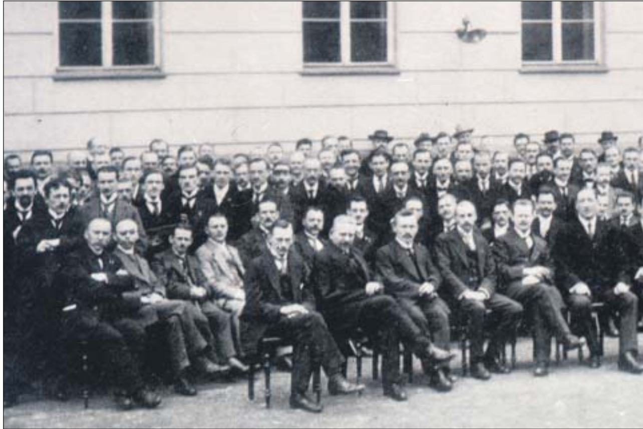
Nicht 90, aber immerhin 89 Jahre alt ist diese Fotografie aus den Gründerjahren des Reichsbundes, des heutigen Sozialverband Deutschland. Zu sehen sind die Teilnehmer des 1. Bundestages in Weimar im Jahr 1918.

Was Kuttner in der Theorie so überzeugend darzulegen vermochte, bereitete in der Praxis ungeheure Schwierigkeiten, die in der Klassenstruktur des Kaiserreiches begründet waren: Wachten auf der politischen Rechten die reaktionären Kriegervereine, die keine Sozialdemokraten aufnahmen, darüber, dass ihnen keine unliebsame Konkurrenz entstand, so fürchteten auf der Linken die Gewerkschaften eine Spaltung der Arbeiterbewegung durch die Gründung einer unabhängigen Kriegsteilnehmer- und Kriegsofferorganisation und stellten sich auf den Standpunkt, dass sie selbst die ge-