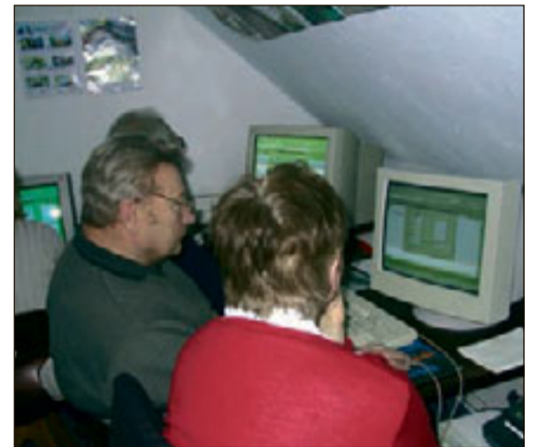
Seit Januar finden regelmäßig Computerkurse für Seniorinnen und Senioren statt.