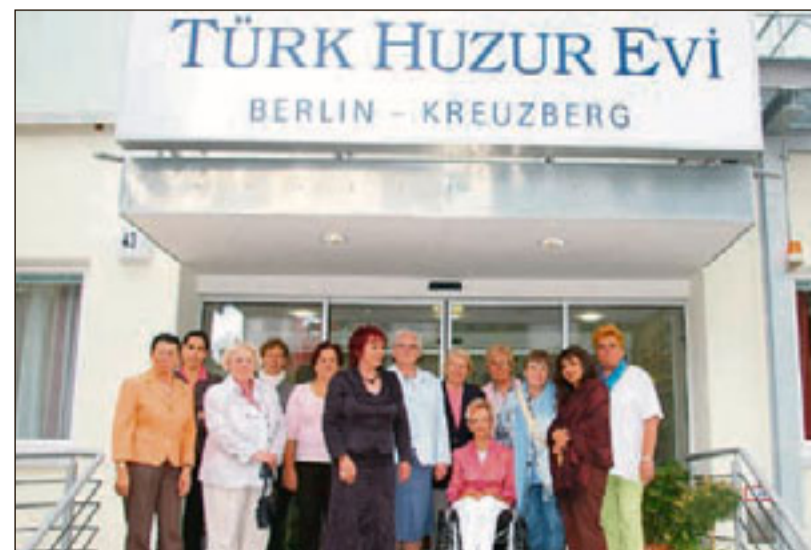
Ein Gruppenfoto der Frauen im Ausschuss für Frauenpolitik des SoVD-Bundesverbandes vor dem Heim „Türk Huzur Evi“.