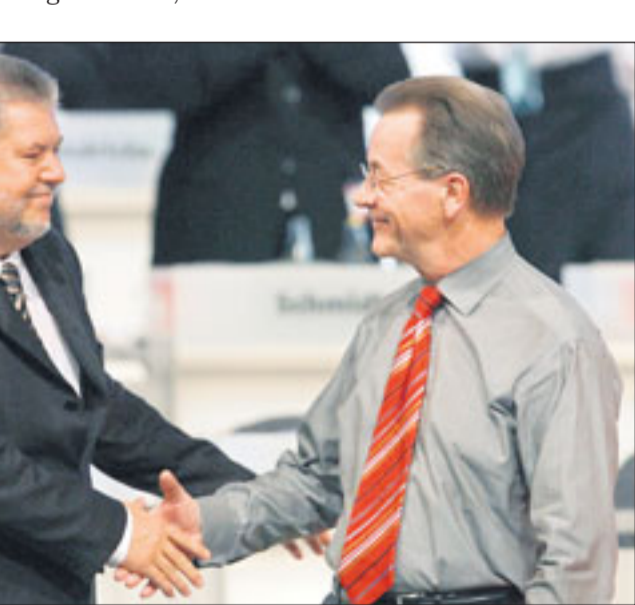
Der SPD-Vorsitzende Kurt Beck (li.) und Vizekanzler Franz Müntefering demonstrierten auf dem Parteitag in Hamburg Einigkeit.

rekturen an der von der Vorgängerregierung verabschiedeten Agenda 2010 im Vorfeld des Parteitages vehement abgelehnt. Noch im November vergangenen Jahres hatten SPD-Politiker eine längere Zahlung des Arbeitslosengeldes I ausgeschlossen. Damals verabschiedete die CDU auf ihrem Bundesparteitag in Dresden einen Antrag des nordrhein-westfälischen Ministerpräsidenten Jür-